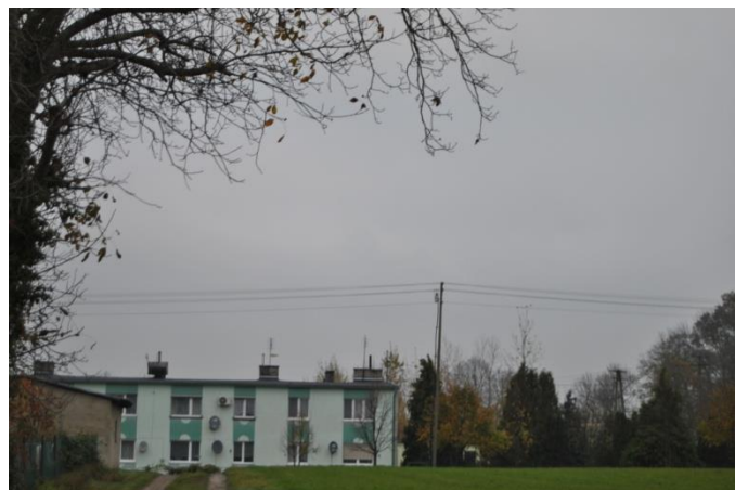
Droga dojazdowa do terenu sportowo – rekreacyjnego