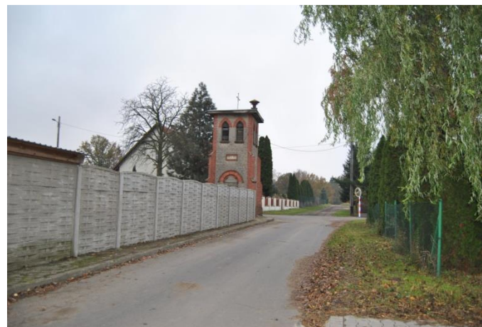
Wieża strażacka w centrum wsi