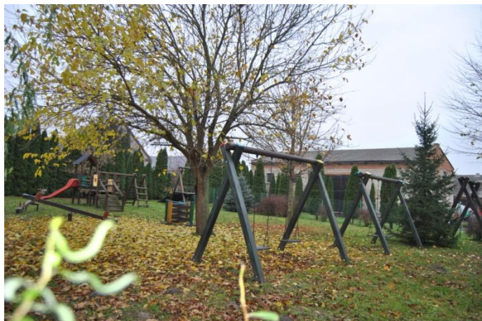
Plac zabaw w centrum wsi